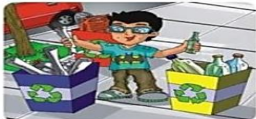
Deposita la basura en el lugar correcto. Luego podrás clasificarla.