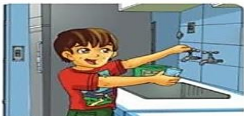
Utiliza solo el agua que necesites, no la desperdicias.