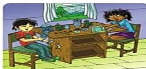
Intenta reciclar algunos materiales y utiliza los que ya están reciclados.