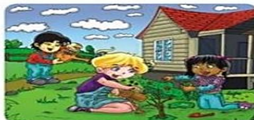
Protege y cuida árboles y plantas que te rodean.