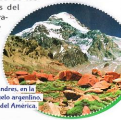
La cordillera de los Andes, en la parte que atraviesa suelo argentino, tiene el pico más alto del América, el cerro Aconcagua.

Las sierras son elevaciones más antiguas y, en general, más bajas que las montañas. Sin embargo, entre las sierras Subandinas se encuentran algunos de los picos más altos del país, como el nevado de Cachi, que alcanza los 6380 metros sobre el nivel del mar.