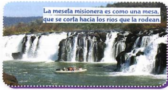
La meseta misionera es como una mesa, que se corla hacia los ríos que la rodean.

La puna o altiplano se ubica en el noroeste, a más de 3.500 msnm.