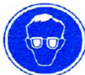
Protección obligatoria de la vista