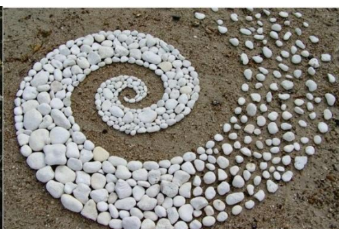
Arte con hojas de un árbol y con piedras en el piso.