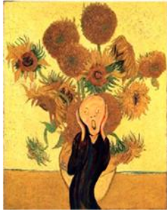
Los girasoles de Van Gogh

La obra el grito es de un artista llamado Edvard Munch y es expresionista. Observa y responde: Qué ves? Que sentirá la persona del cuadro? Los colores que eligió ayudan a expresar el sentimiento de esa persona. Si le cambiáramos el fondo y los colores daría la misma sensación? Observa los siguientes ejemplos de pinturas famosas a las que les agregamos la imagen del grito. Dan la misma sensación que la pintura original?