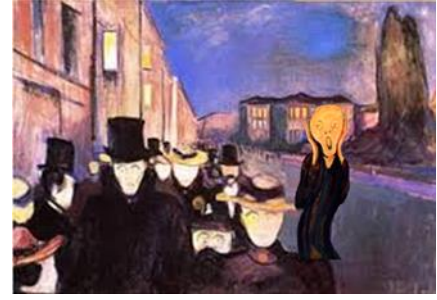
Atardecer en la avenida

Te propongo que representes, en un espacio de casa, esta pintura y saques una fotografía.