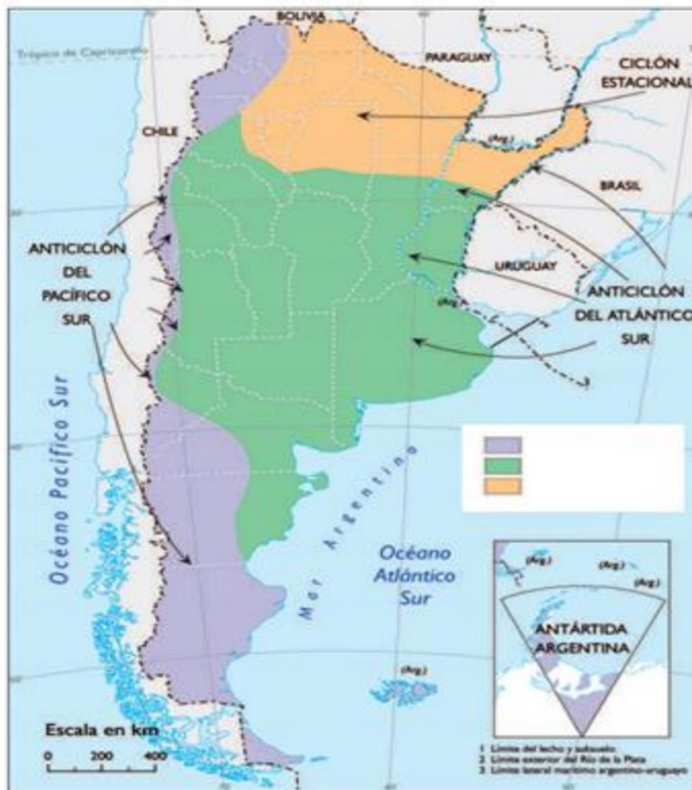
Mapa de climas