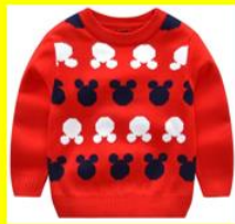
BUZO O PULLOVER

TEJIDO CON LANA O DE TELA POLAR, LA PANCITA Y LOS BRAZOS TE VAN A ABRIGAR.