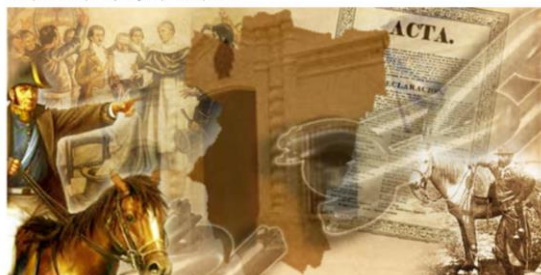
9 de Julio de 1816 en perspectiva Lucha por la emancipación y Congreso por la Independencia