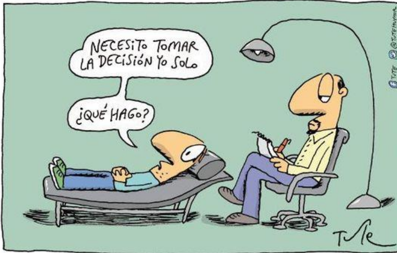
Tute, Humor al diván (Sudamericana, 2017)

12.1. ¿Quién es el autor de la viñeta? ¿Cuál es la fuente?