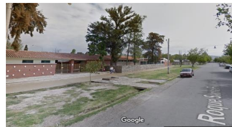
Escuela Cornelio Saavedra

Sabemos que ustedes harán un gran y bonito trabajo. ¡Adelante!