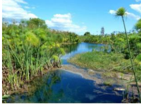
Papiros planta egipcia.