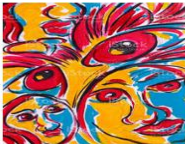
IMAGEN A MODO DE EJEMPLO:

ACTIVIDAD 2: RECORTAREMOS TODAS LAS FIGURAS DE LA CLASE ANTERIOR DE FORMA PROLIJA Y LAS IREMOS PEGANDO EN UNA CARTULINA, FORMANDO ROSTROS EN TODA LA CARTULINA.