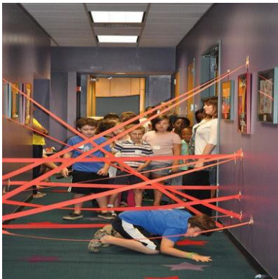
Imagen a modo de ejemplo