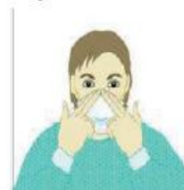
5. Ajuste los costados de la nariz utilizando los dedos.