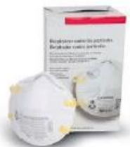
1. Retire el protector del envase.