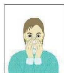
6. Ajuste correctamente la máscara.