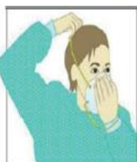
3. Coloque la máscara sobre su cara con la pieza nasal sobre su nariz. Pase el elástico superior sobre su cabeza.