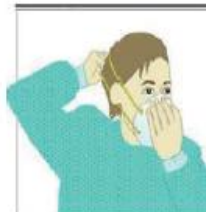
4. Pase el elástico inferior y colóquelo debajo de la oreja y sobre el cuello.