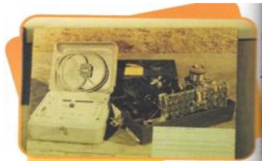
Antiguo medidor sísmico.