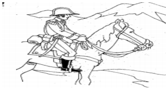
UN HOMBRE DE YAPEYÚ