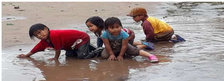
Un grupo de niños wichí de la comunidad indígena de El Quebracho, en el norte de Argentina. La legislación reconoce el derecho a la educación bilingüe para la niñez originaria, pero en la realidad esa práctica no se cumple y a los niños se los discrimina cuando hablan su lengua.