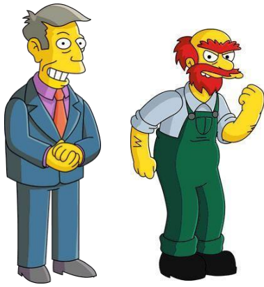
SKINNER /FAMOUS/ WILLY