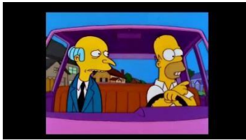
FLANDER'S CAR / FAST/ HOMER'S CAR