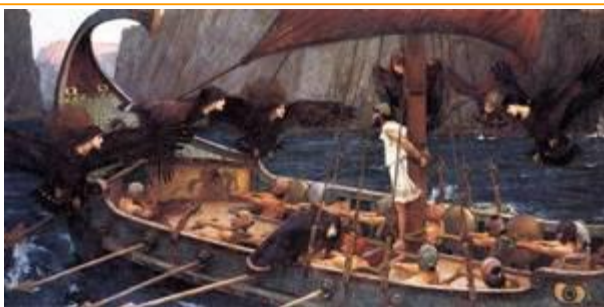
Ulises quiso escuchar el canto de las sirenas.

Las sirenas vivían en la isla de Artemisa, en donde yacían los huesos de los marineros que habían sido atraídos por sus deliciosos cantos.