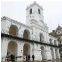
El Cabildo de Buenos Aires.

24 de mayo: los ciudadanos critican la decisión de mantener a Cisneros en el esquema de poder y redoblan la presión sobre el Cabildo Abierto. La protesta desencadenó en la renuncia de todos los miembros de la Junta del 23 de mayo.