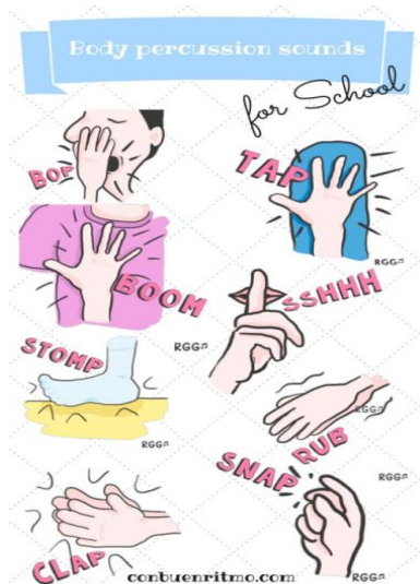
Ritmo corporal 1

1. Antes de volar el barrilete, te propongo que descubras tus emociones: Realizaremos percusión corporal y aprenderemos sobre las emociones. (seguir el video) https://www.youtube.com/watch?v=GZjxEmqTOgg&feature=youtu.be