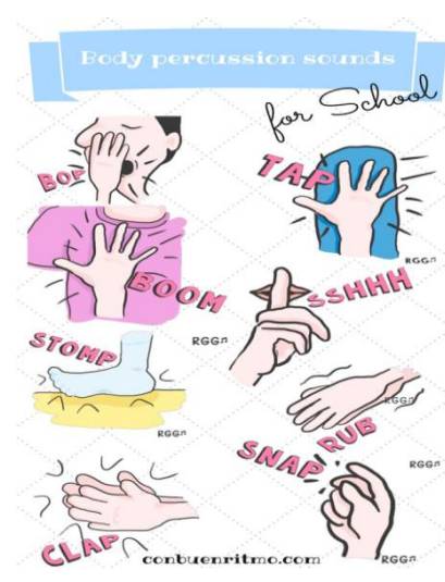
Ritmo corporal 2