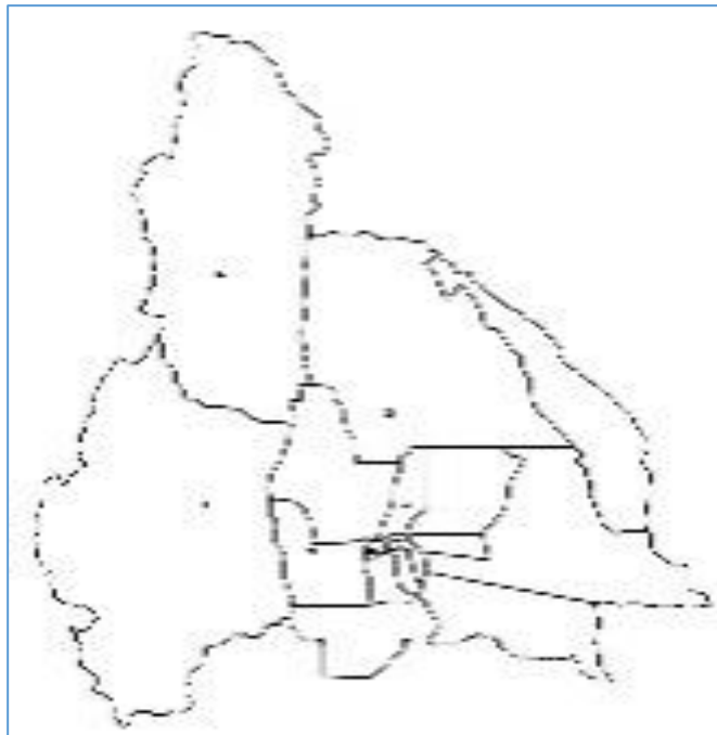
MAPA DE SAN JUAN

Realizar el (dado y mapa de San Juan) con distintos tipos de materiales reciclados utilizando herramientas o máquinas (medios técnicos) según lo requiera.