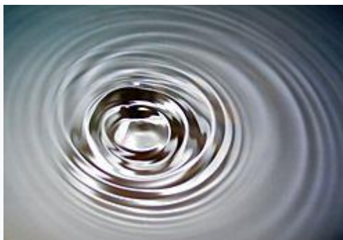
Ondas superficiales en agua