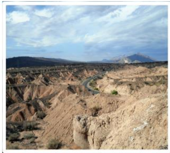
Paisaje Protegido "Loma de Las Tapias", Ullum

Son sistemas complejos, constituidos por un conjunto de elementos físicos (factores abióticos) en constante interacción, que utilizan flujos de energía procedente del exterior, (en última instancia de radiación solar) e información para desarrollar funciones de mantenimiento y producción de especies, con un nivel de organización que los conforma.