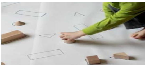
Imagen a modo de ejemplo.