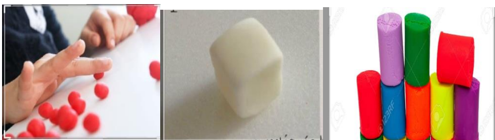
Imagen a modo de ejemplo.

¡Con las manos en la masa! Con masa de sal, plastilina, barro o cualquier masa que tengan en casa, modelar, cuerpos geométricos, 4 o 5 de cada uno, (de los que vieron en el video y en el cuento de las actividades anteriores). Dejar secar. Pintar y decorar con lo que tengan disponible.