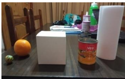
Imagen a modo de ejemplo.