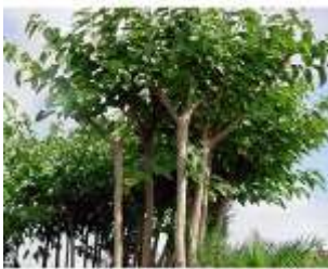
ARBOLES FORESTALES (MORA).

Los árboles forestales son aquellos que dan sombra, y los árboles frutales, como su nombre lo dice, son aquellos que dan frutos.