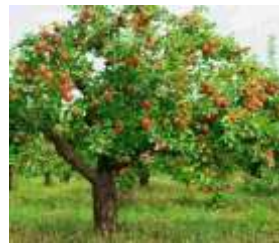
ARBOLES FRUTALES (DURAZNO).

-Investigar por los alrededores del hogar los tipos de árboles que hay.