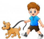
ELISEO SALE DE PASEO

RIMA CON LOS NOMBRES: Observamos las imágenes y escuchamos con que riman esos nombres.