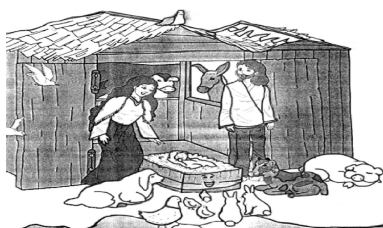
SUSANA PALMIRA PAEZ

se lo llevaron al aserradero. Allí, lo cortaron, y luego, lo guardaron por largo tiempo en una oscura bodega, donde el