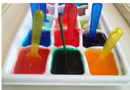
Ejemplo de pintura