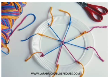
Ejemplo imagen 1