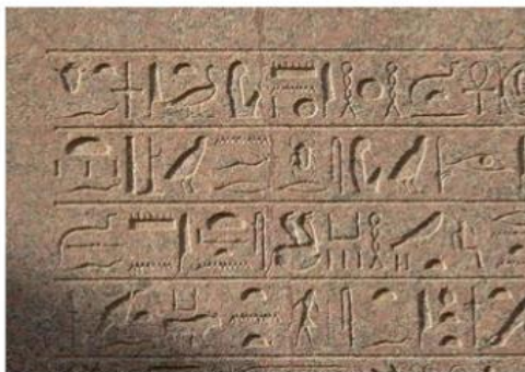
Jeroglíficos del templo de Karnak.

Es Fonética cuando el sonido de un símbolo se combina con otro para formar una nueva palabra. Un ejemplo más: Sol + dado = Soldado.