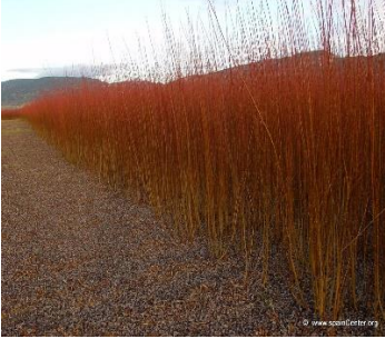
El mimbre y su uso