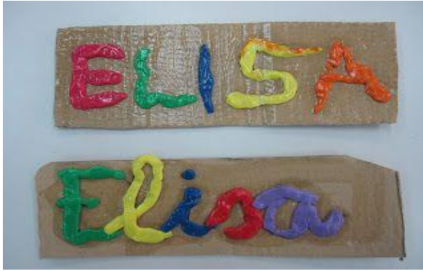
Solo en mayúscula (como arriba)