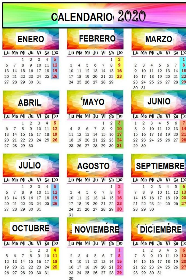
MODELO DE CALENDARIO PARA EL CUADERNO

Tenemos un desafío volver a armar el calendario del jardín: Les cuento que hace unos días fui al jardín porque quería buscar el calendario con todo lo que habían trabajado durante el año y cuando iba saliendo se me volaron todas las fotos y el calendario de nuestro jardín se me desarmó. Pensé y pensé y dije seguro los alumnos se acuerdan lo que hemos trabajado y me va a ayudar a armarlo de nuevo.