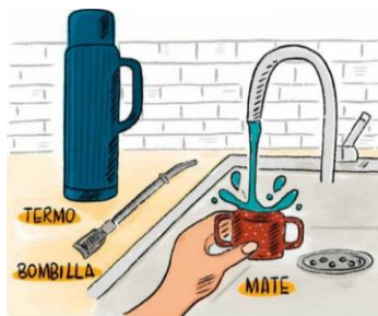
TANTO EL MATE, COMO LA BOMBILLA Y EL TERMO, PUEDEN SER CONSIDERADOS COMO UTENSILIOS.