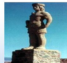
Cacique Pismanta. Monumento en Angualasto

Propio Común Individuales Colectivos Femenino Masculino