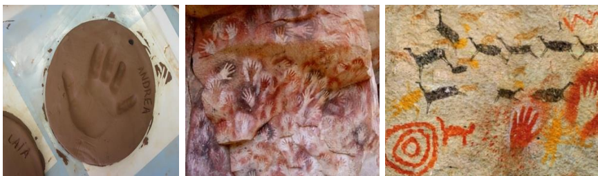
Ejemplo de la actividad - Detalle “Cueva de las Manos” Patagonia Argentina