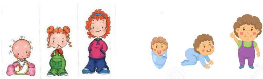
Imágenes ilustrativas para la actividad