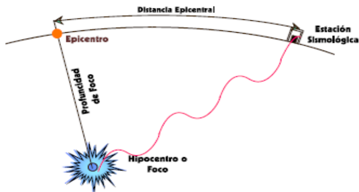
Figura 2: Esquema de la trayectoria sísmica, entre el foco y la estación.

ONDAS SÍSMICAS: En la teoría de propagación de ondas elásticas en medios sólidos, se consideran dos tipos de ondas principales que se generan en un terremoto: ondas P (Primarias) y ondas S (Secundarias). Estas son ondas internas que pueden viajar a través del interior de la tierra; la onda P es la primera que se percibe y la onda S es la segunda. Esta última posee más energía que la P y es la que produce los mayores daños a las construcciones.