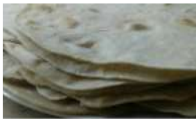
Masa de tacos estilo rapidita

Luego agregamos el agua en dos veces hasta lograr una masa húmeda, dejamos descansar 10 minutos y la dividimos en 7 bollitos. Posteriormente la estiramos y cocinamos en sartén durante tres minutos aproximadamente. .