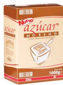
Azúcar en caja