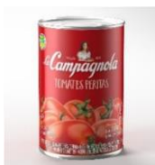
Lata de Tomate