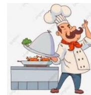
COCINERO O CHEF