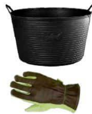
Capazo y guantes