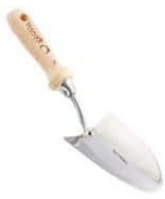
Trasplantador o palita