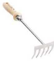
Rastrillo de mango