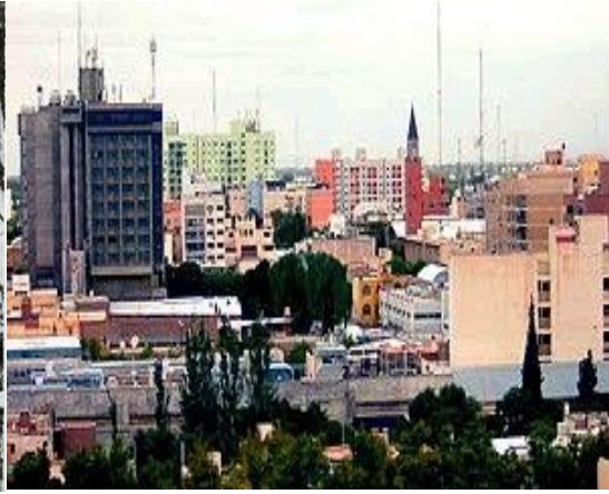
San Juan actual