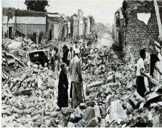
San Juan antiguo

El 15 de enero de 1944, San Juan sufrió el terremoto más destructivo de su historia.