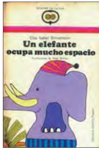
«UN ELEFANTE OCUPA MUCHO ESPACIO»

Elsa Bornemann nació en Argentina, ha recibido numerosos premios y distinciones en el campo de la literatura infantil. Además, ha publicado muchísimos libros para niños, entre los que se destacan: Disparatario , El niño envuelto , ¡Socorro! , Tinke-Tinke , El espejo distraído , Un elefante ocupa mucho espacio , Los Grendelines , Cuadernos de un delfín , El libro de los chicos enamorados (55 poemas y un cuento) y No somos irrompibles . Sus obras han sido incluidas en antologías y libros de texto; fueron editadas en fascículos, en CD-Roms y se publicaron en importantes diarios y revistas. Muchos de sus libros se tradujeron a otros idiomas y algunos de ellos también al sistema Braille para ciegos.