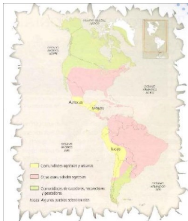
▲ Distribución de algunos pueblos originarios antes de la colonización española.

La base del conflicto, entre otros motivos, fue la competencia por la ocupación de la tierra, pugna en la cual los pueblos originarios salieron desfavorecidos. Muchos fueron exterminados y otros, incorporados como mano de obra en los nuevos territorios.