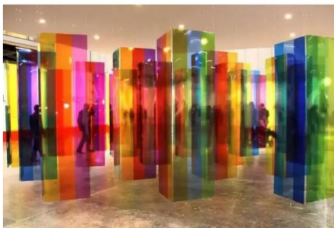
Su obra 'Laberinto de transcromía'