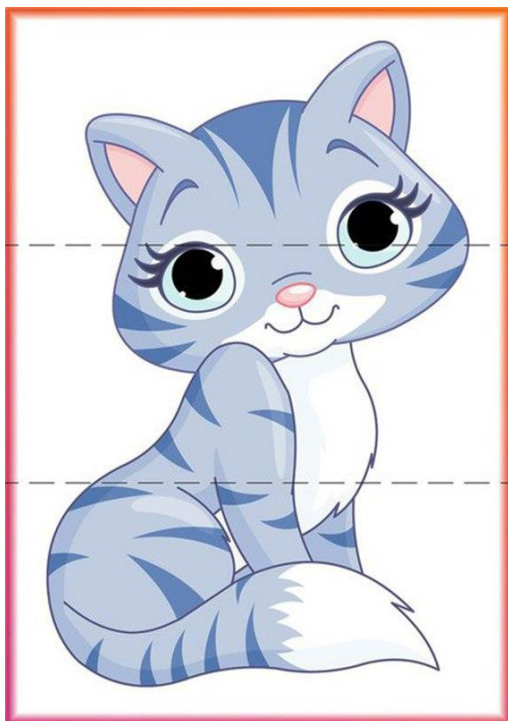
De tres partes

Jugar con el rompecabezas que hicieron. Con el tiempo pueden confeccionar otros rompecabezas para tener variedad.