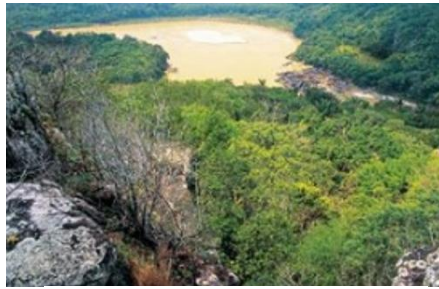
Ambiente de transición