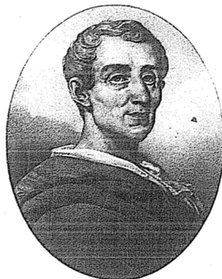
Montesquieu fue el inspirador del modelo de organización de las repúblicas que reemplazaron a los regímenes monárquicos.