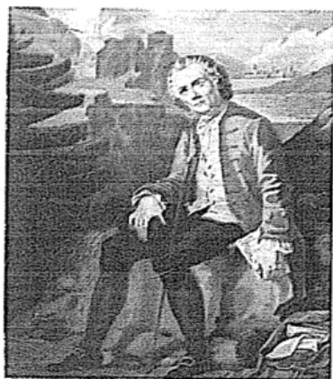
Este grabado de la época muestra a Jean Jacques Rousseau reflexionando acerca de la naturaleza y la sociedad.