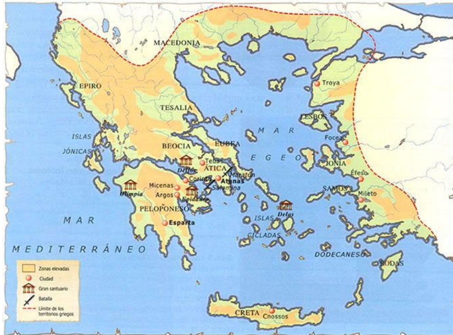
Mapa de la Grecia antigua